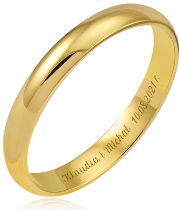
7 - Petit Formal Script