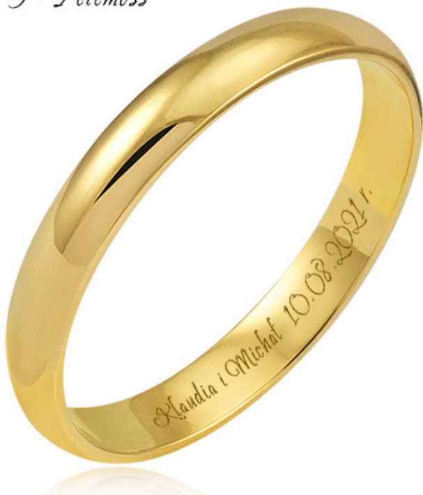
9 - Petemoss