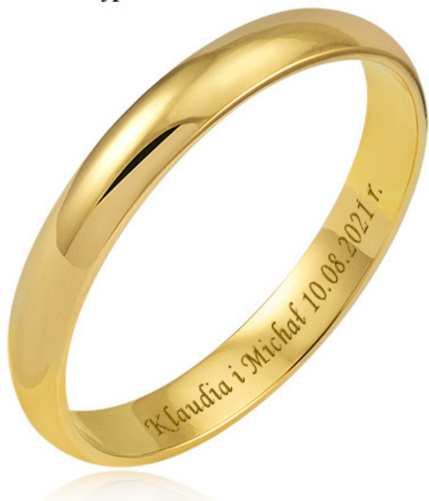
1 - Monotype Corsiva