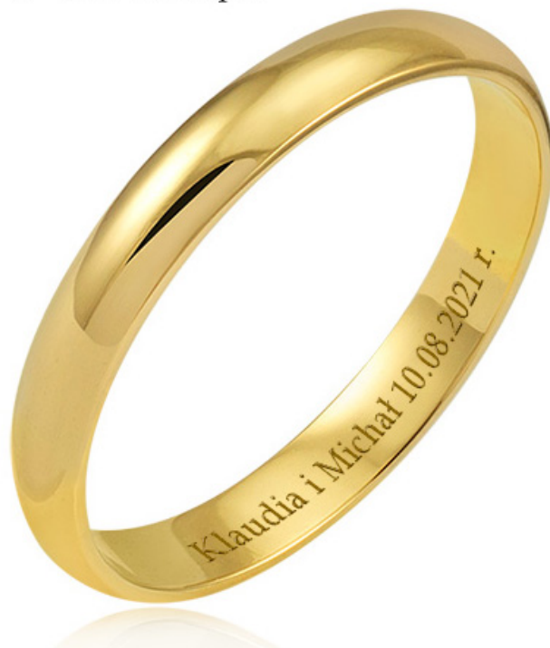
2 - Book Antiqua