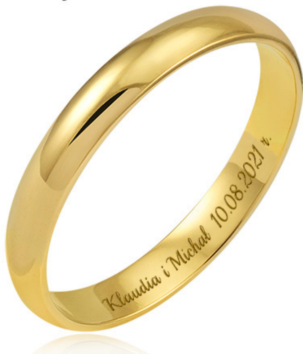
3 - Playball