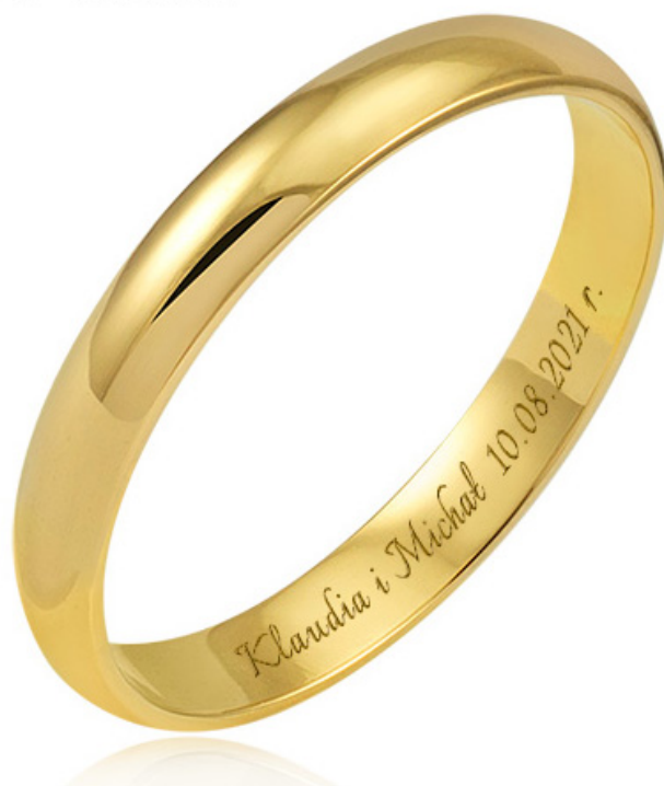
6 - Italianno