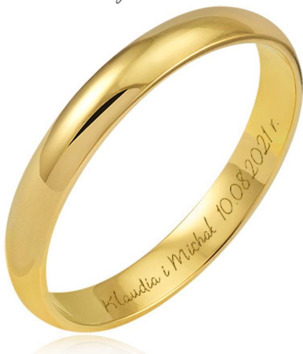
5 - Oooh Baby